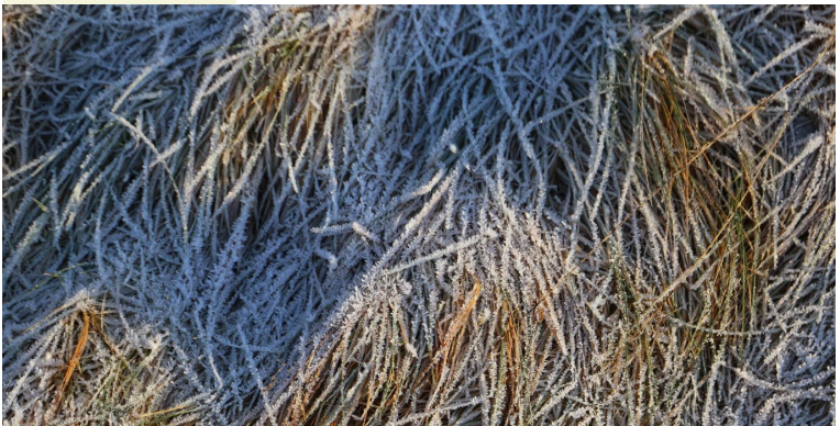
Figure 3: The frozen ground is about to meet sunshine.

Donec consequat mi. Quisque vitae dolor. Integer lobortis. Maecenas id nulla. Lorem ipsum dolor sit amet, consectetur adipiscing elit. Sed volutpat felis vitae dui. Vestibulum et est ac ligula dapibus elementum. Nunc suscipit nisl eu felis. Duis nec tortor. Nullam diam libero, semper id, consequat in, consectetur ut,