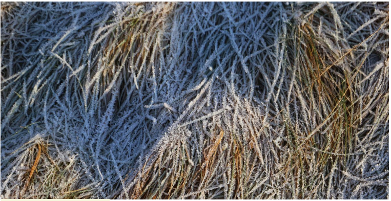
Figure 1: The frozen ground is about to meet sunshine.

Maecenas accumsan, sem iaculis egestas gravida, odio nunc aliquet dui, eget cursus diam purus vel augue. Donec eros nisi, imperdiet quis, volutpat ac, sollicitudin sed, arcu. Aenean vel mauris. Mauris tincidunt. Nullam euismod odio at velit. Praesent elit purus, porttitor id, facilisis in, consequat ut, libero. Morbi imperdiet, magna quis ullamcorper malesuada, mi massa pharetra lectus, a pellentesque urna urna id turpis. Nam posuere lectus vitae nibh.